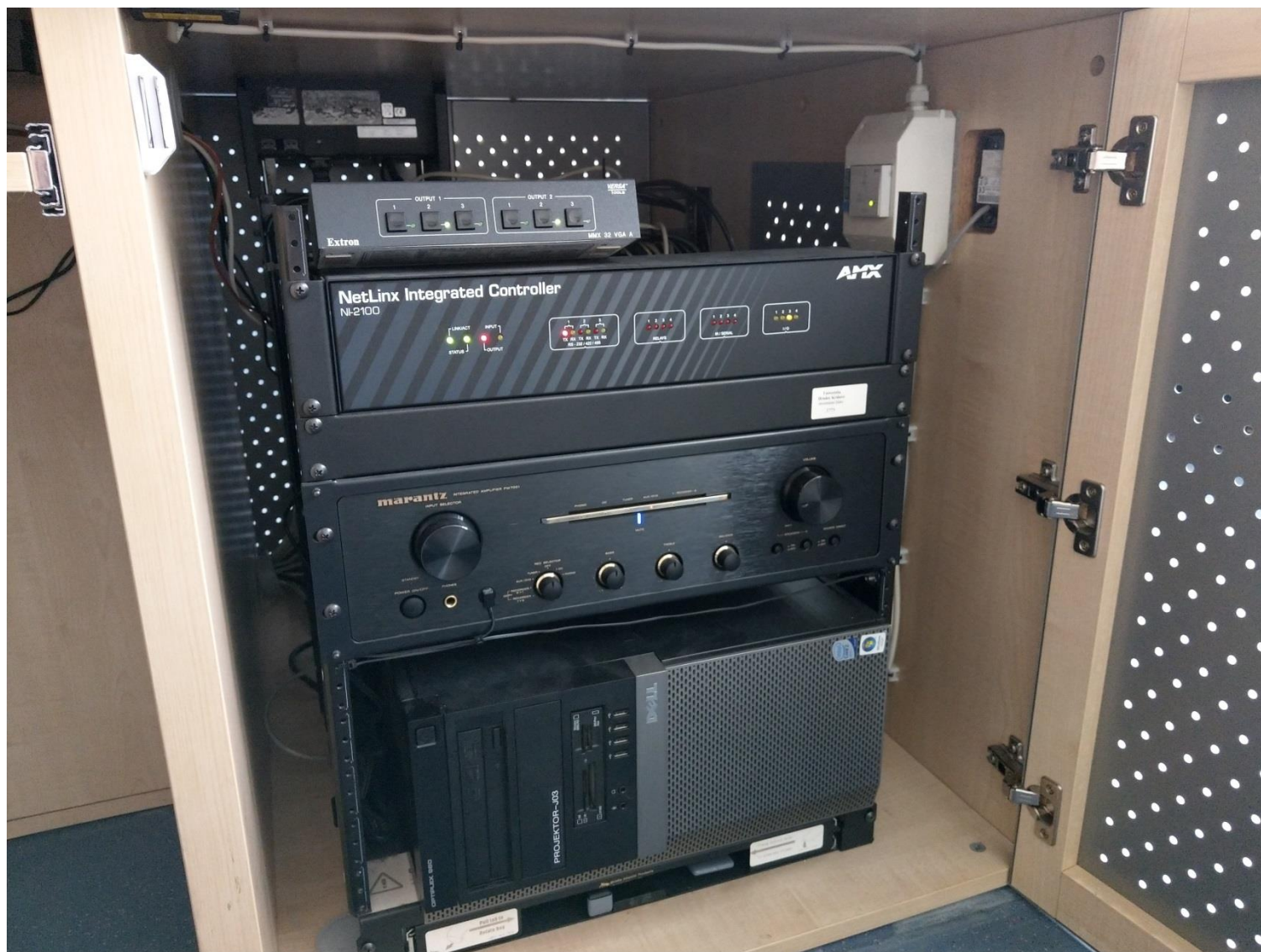
Obr. č. 7 - technika uvnitř katedry, přepínač výstupů, kontrolér, zesilovač, PC