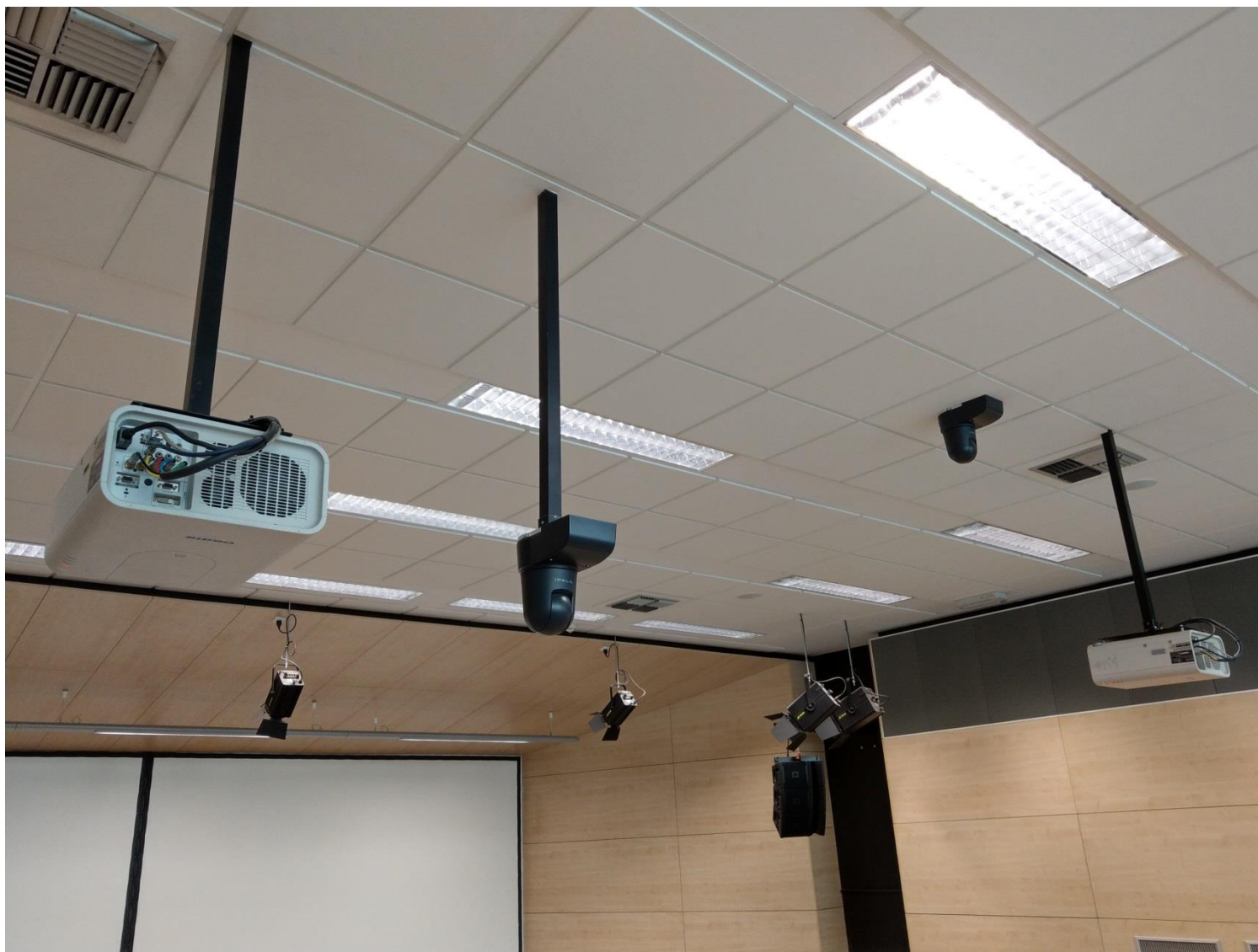
Obr. č. 12 - zadní pohled na oba projektory a kamery (jedna umístěná přímo na podhledu, druhá na konzoli)