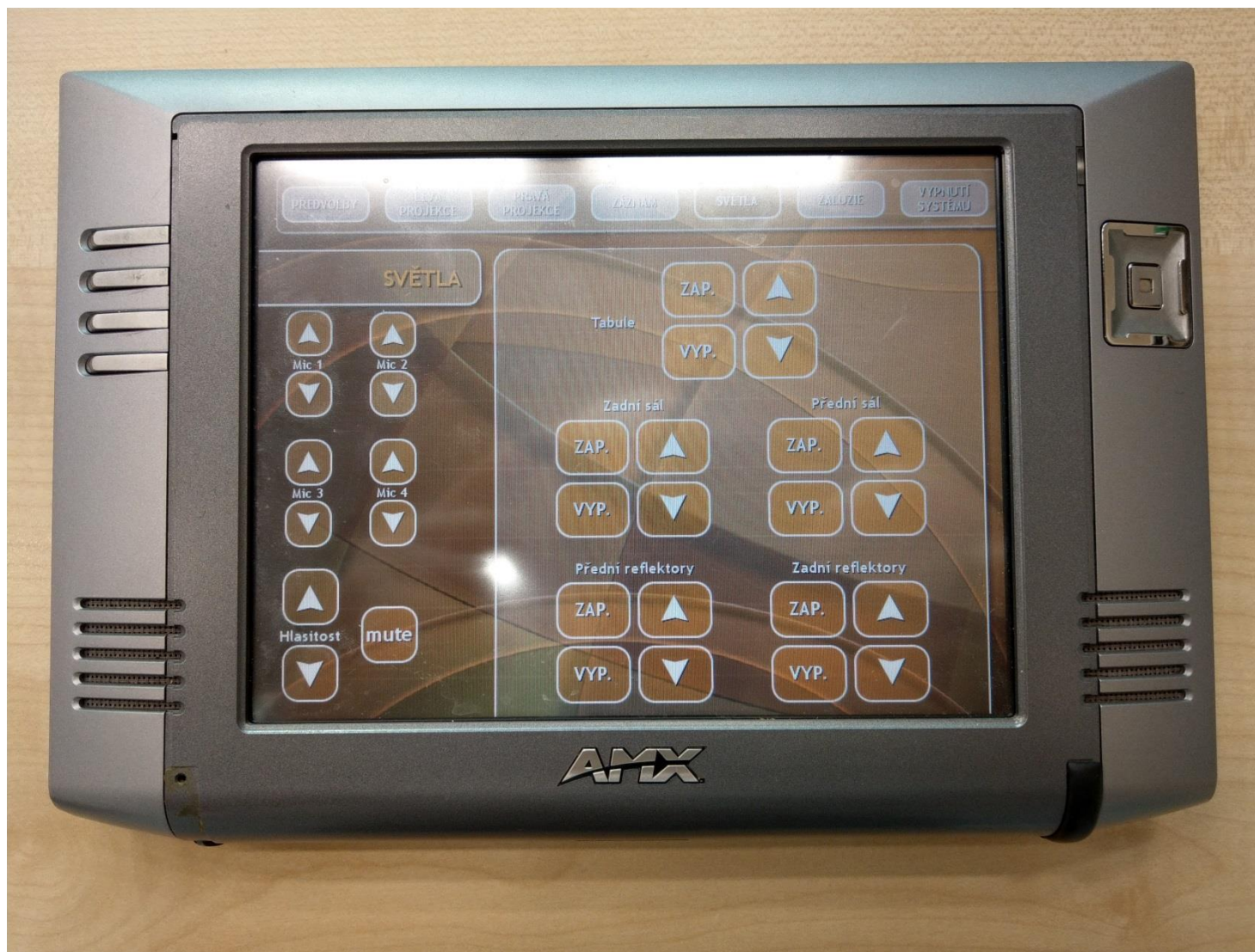
Obr. č. 10 - detail na ovládací panel