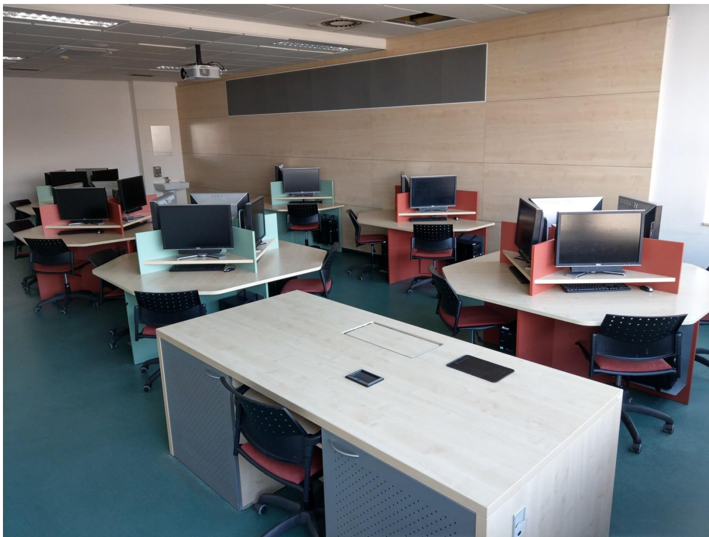
Obr. č. 2 - počítačová učebna