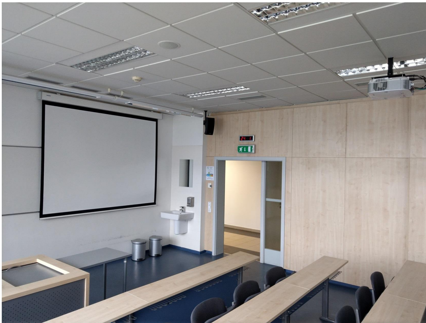
Obr. č. 14 - pohled na projektor a promítací plátno na seminární učebně