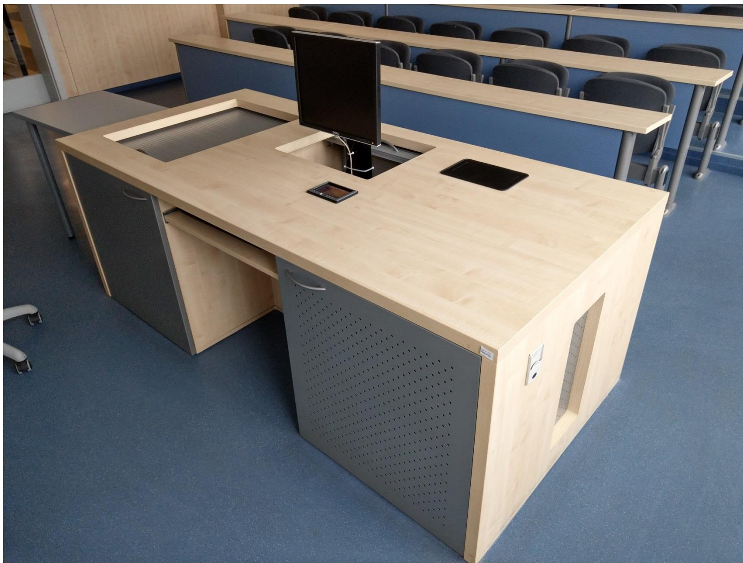
Obr. č. 4 - detail na katedru s vysunutým monitorem