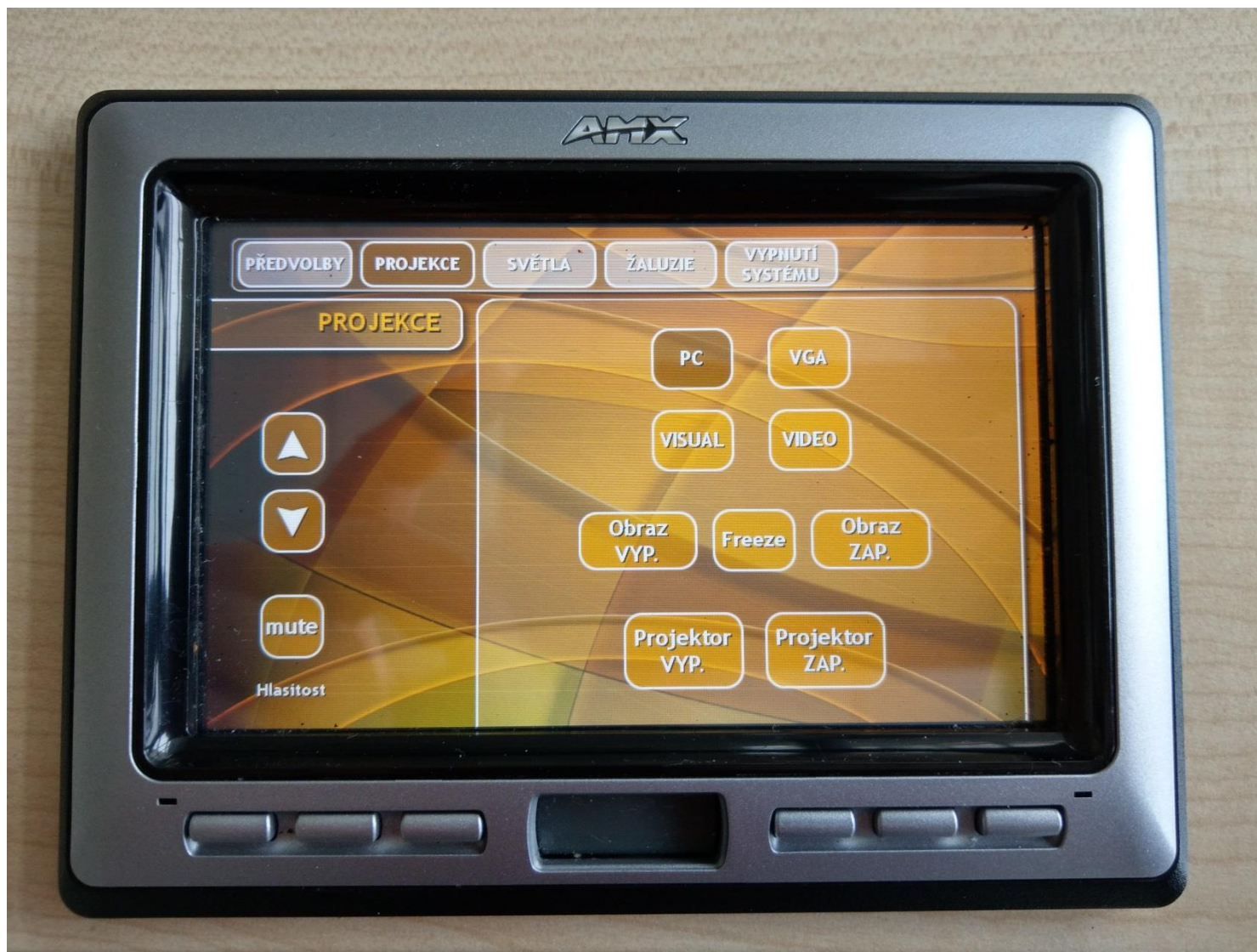
Obr. č. 5 - detail na ovládací panel