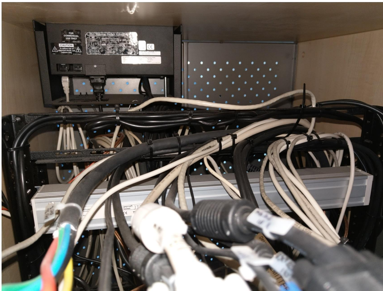
Obr. č. 8 - kabeláž uvnitř katedry, vzadu je vidět zapojení přípojného místa