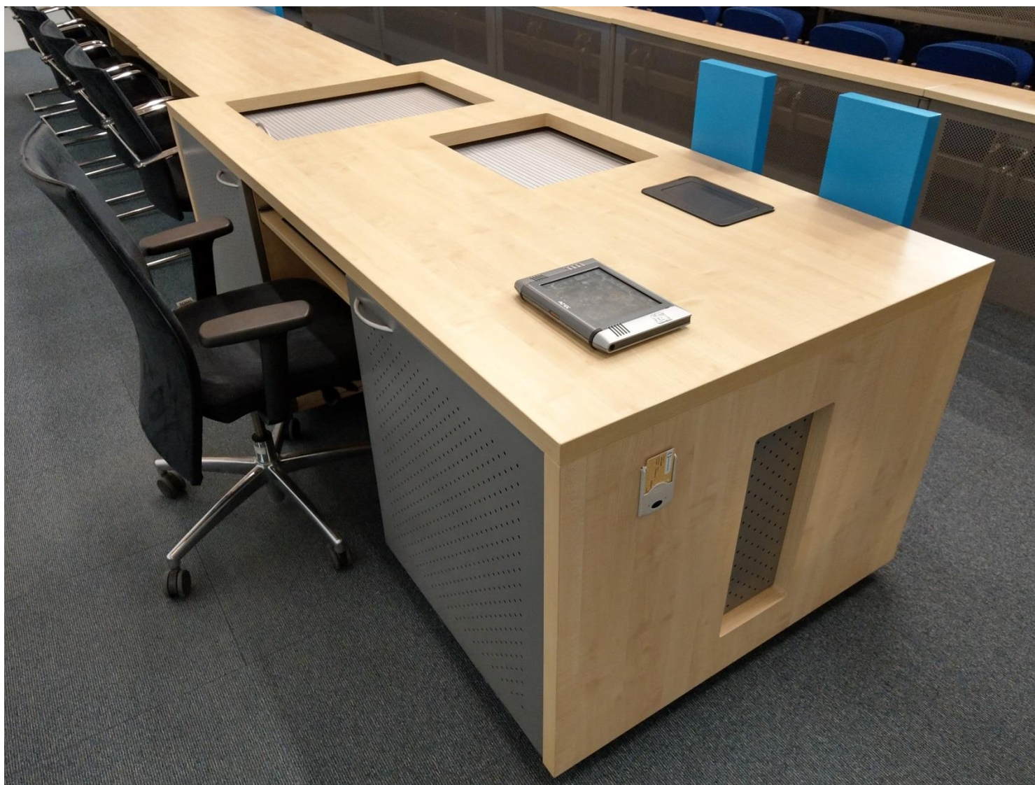
Obr. č. 9 - katedra s bezdrátovým dotykovým ovládáním na Aule