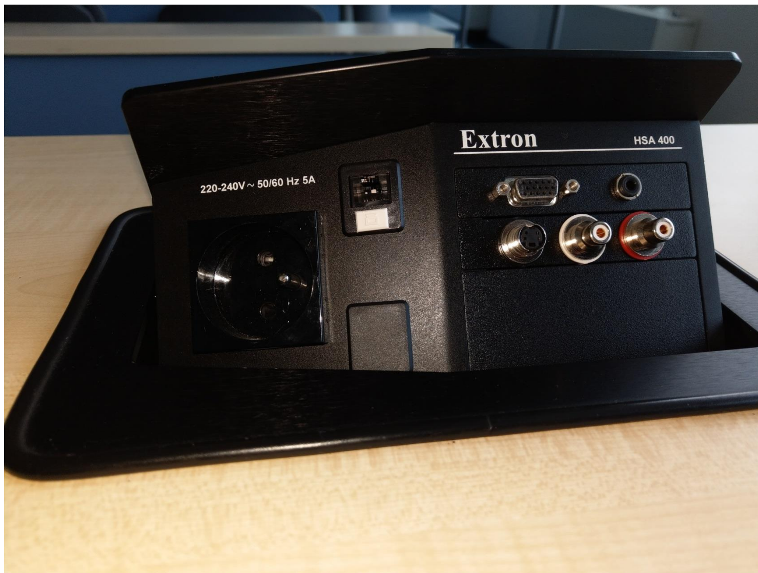
Obr. č. 6 - přípojnÉ místo