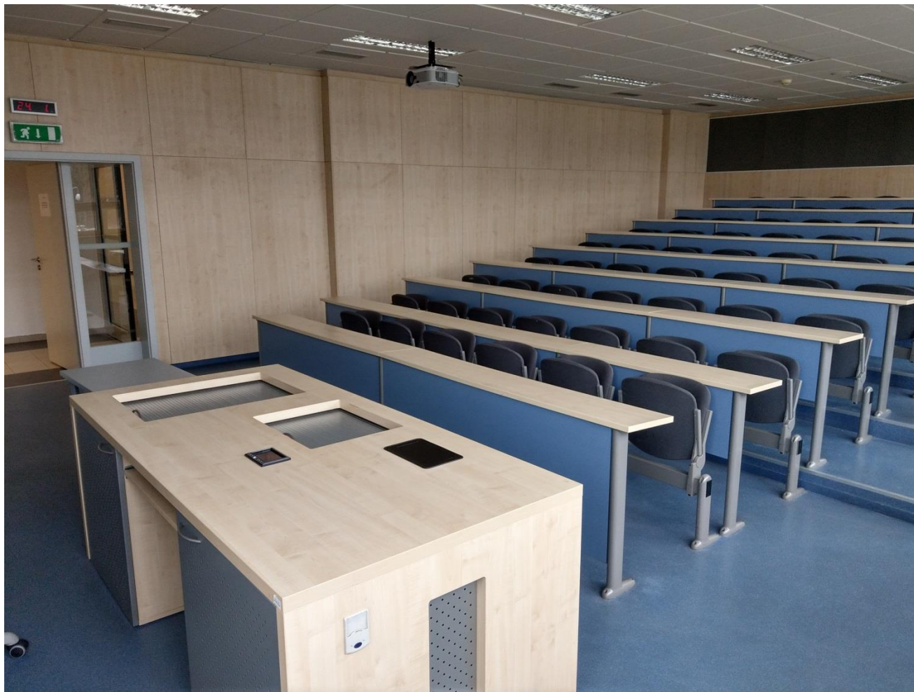
Obr. č. 1 - seminární učebna