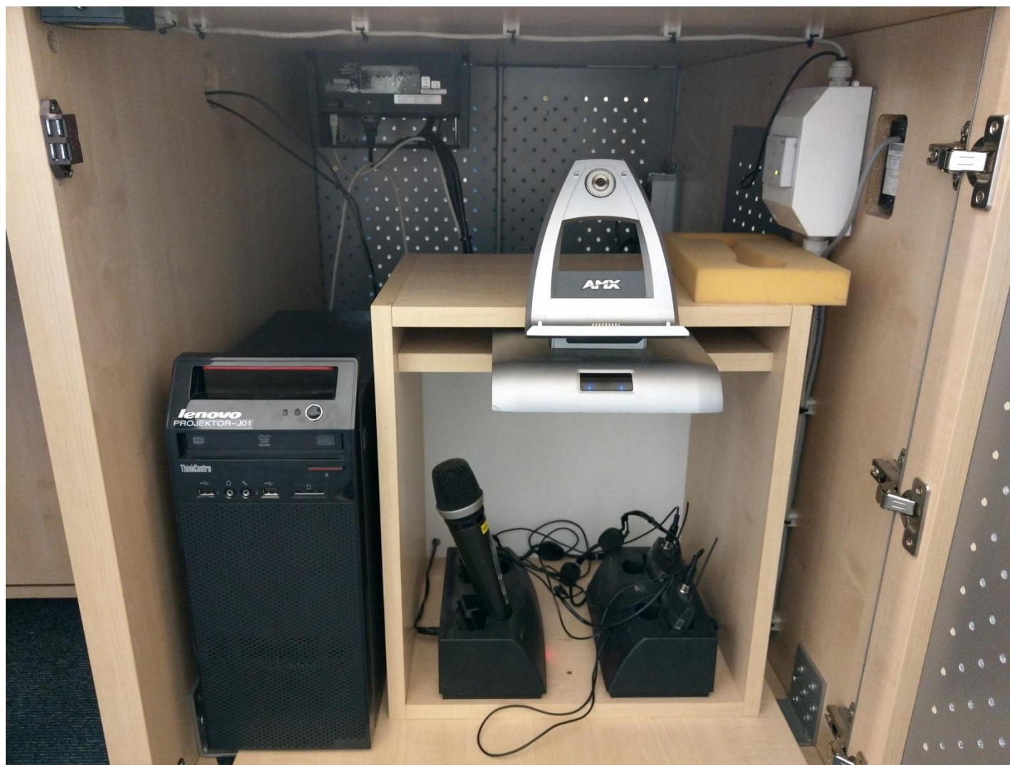
Obr. č. 11 - vnitřek katedry na Aule, dobíjecí místo na bezdrátový panel