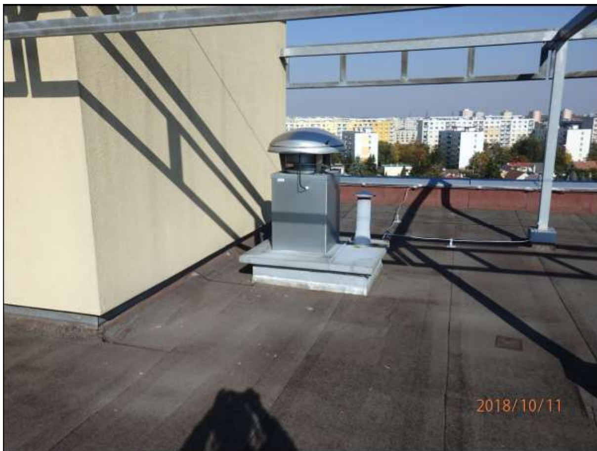
Centrální digestoř a mechanická větrací hlavice na stoupacím kanalizačním potrubí bytových jader (na střeše hlavního objektu) (2 snímky) – navrženo dílčí doplnění digestoří.