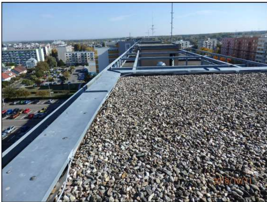
Obrácená plochá střecha na výtahových šachtách hlavního objektu – lokální zatékání skrz hydroizolaci do strojoven výtahu (2 snímky).