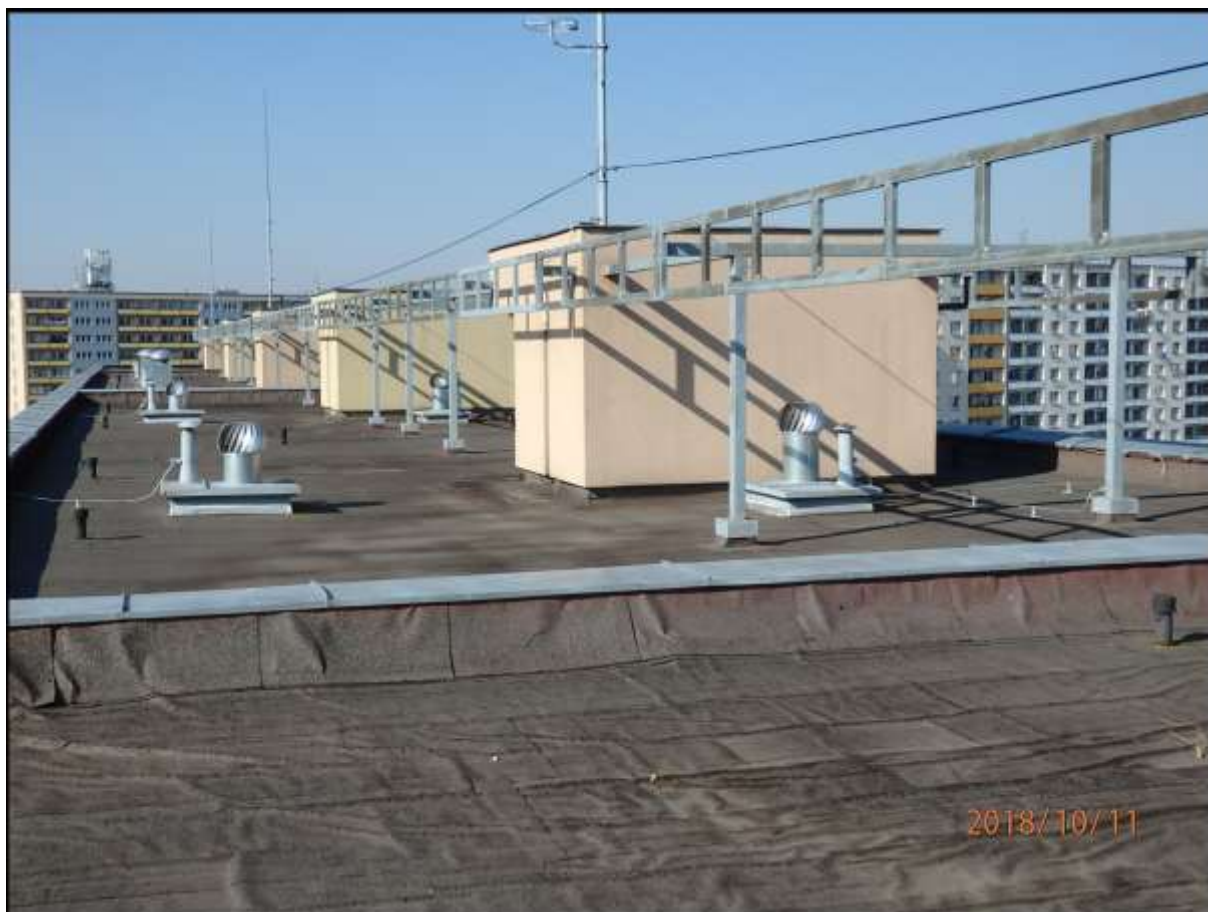
Plochá střecha hlavního objektu – závada nedostatečné kotvení střešní krytiny (4 snímky).